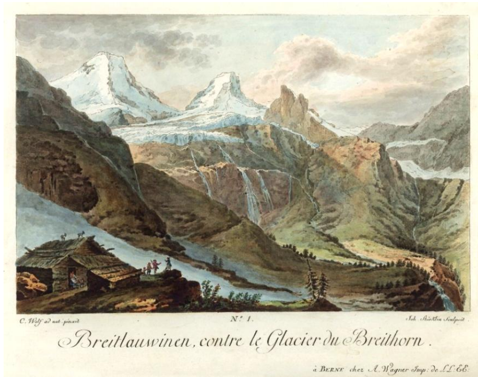
Breitlauwinen, contre le glacier du Breithorn , handkolorierte Umrissradierung, nach Caspar Wolf, gestochen von Johann Joseph Störklin (Merkwürdige Prospekte aus den Schweizer Gebürgen, Bern 1777, Nr. 1)