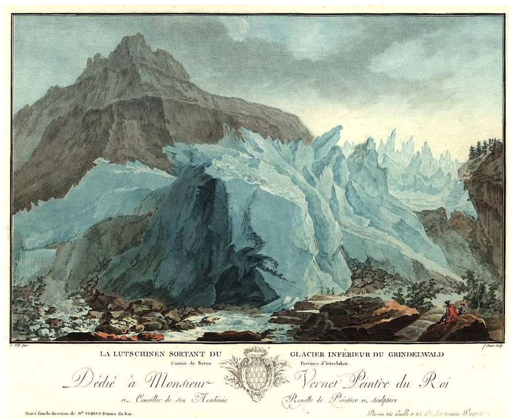
La Lutschinen sortant du glacier inférieur du Grindelwald , nach Caspar Wolf gestochen von Jean-François Janinet (Vues remarquables des montagnes de la Suisse, Paris, 1780-82)

Ambitioniertes Publikationsprojekt: Davon verwendete Wagner in den Jahren 1777–82 vorerst nur gerade mal 17 als Motivvorlagen für insgesamt 30 Kupferstiche in drei verschiedenen Publikationsfolgen, die – mit naturwissenschaftlichen Texten in Deutsch und Französisch angereichert – in Bern und Paris allesamt unvollendet erschienen. Die Ansprüche waren zu hoch, und die Produktion erwies sich als zu aufwändig für einen grösseren und schnelleren Output. Nach Wagners Tod 1782 publizierten seine Rechtsnachfolger in Amsterdam und Paris über die schon von ihm verwendeten Wolf'schen Motive hinaus 9 weitere nach Wolf und zusätzlich 16 nach Vorlagen anderer Urheber. Diese erweiterte Ausgabe wurde – wie auch schon von Wagner begonnen – im neuen Druckverfahren der Farbaquatinta hergestellt. Nebst dem sehr ambitionierten (und letztlich gescheiterten) Projekt Wagners erschienen im späten 18. Jahrhundert gemäss unserem Kenntnisstand gegen 150 weitere Stiche nach Motiven von Caspar Wolf, herausgegeben von anderen Verlegern der Zeit (Johann Anton Ochs, Bartholome Fehr, Johann Heinrich Bleuler, C. D. Werner, Martin Engelbrecht u. a.), einige – wie beispielsweise die sog. Trachtenfolge – auch im Vertrieb durch Caspar Wolf selbst.