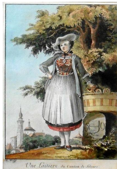
Une Laitière du Canton de Soleure, 1777-79, Umrisradierung, nach Caspar Wolf, gestochen und koloriert von Caspar Wyss (Trachtenfolge Nr. 7)

Wir danken diesen Partnern für finanzielle Unterstützung (Stand 1.12.2025):