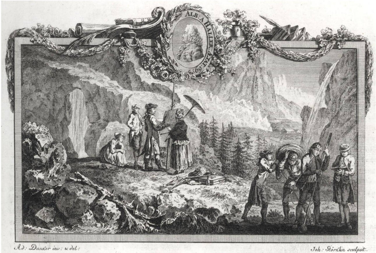
Titelvignette zu Merkwürdige Prospekte , von B. A. Dunker nach Motiven von Caspar Wolf, gestochen von J. J. Störklin, 1777

Grosses Erkenntnispotenzial: Die Druckgrafik nach Caspar Wolf bietet sich als interessanter und exemplarischer Forschungsgegenstand zum Thema der Geschichte der Druckgrafik an. Dies nicht zuletzt, weil sie am technischen Wendepunkt von der handkolorierten Umrissradierung zum Farbdruck entstand. Wagner und Wolf konnten für die 3. Ausgabe der Vues remarquables 1780–82 in Paris den Stecher Jean François Janinet, der zu jener Zeit die noch jungen Farbaquatintaverfahren wesentlich weiterentwickelt hatte, für eine Zusammenarbeit gewinnen.